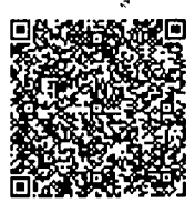
สิ่งที่ส่งมาด้วย_1